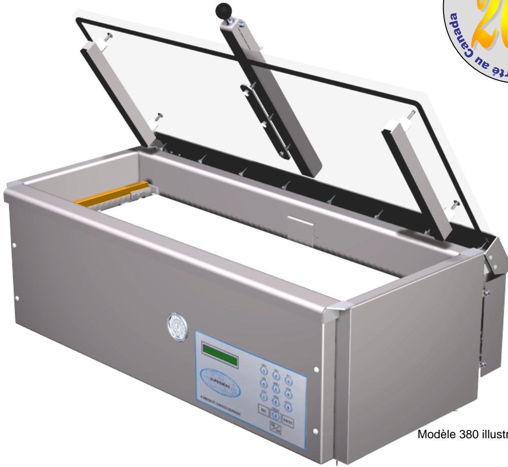
Modèle 380 illustré